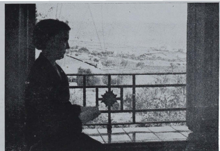
Vista, desde una de las ventanas del Albergue.