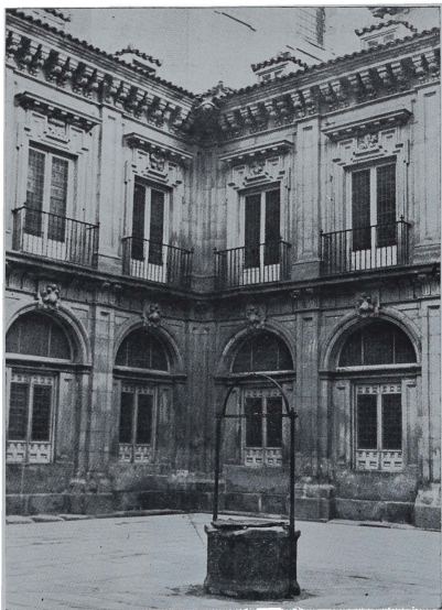
Patio interior de lo que es hoy el Instituto de San Isidro en el lugar que ocupó el antiguo "Estudio de Madrid".

ficio que el Estudio fué trasladado a la calle de la Villa.