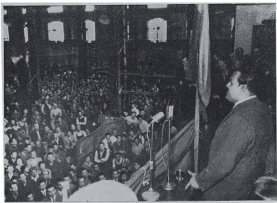
EL MINISTRO DE TRABAJO EN VALENCIA.—El Sr. Girón, pronunciando una alocución ante 2500 obreros de la Unión Naval, con motivo de su visita a aquella zona portuaria.

Los Ministros de Hacienda y Obras Públicas llegaron a Madrid, procedentes de Jaén. A su paso por Úbeda y Linares, fueron objeto de un entusiasta recibimiento por parte de la población. En esta última localidad el Conde de Valledano pronunció un discurso desde el balcón principal del Ayuntamiento ante todo el pueblo congregado en la Plaza y calles adyacentes. Anunció que, en fecha breve, quedará resuelto el problema de abastecimiento de aguas de Linares y que, con toda urgencia, se estudiarán, por los técnicos de su Departamento, las mejores de comunicaciones que afectan a esta localidad. También pronunció breves palabras el Ministro de Hacienda.