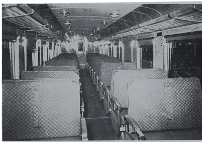
NUEVOS AUTOMOTORES PARA ESPAÑA: El primer tren completo articulado T.A.F. (tren Automotor Fiat), de los veinte que en las factorías de Turin han sido construídos para la Red Nacional de Ferrocarriles Españoles. Es un tren capaz de transportar más de 200 pasajeros y está provisto de instalaciones modernísimas que permiten hacer largos viajes con las máximas comodidades.

El Príncipe Regente del Iraq visitó el Museo del Prado y la Exposición Permanente de la Industria Española, instalada en el Instituto Nacional de Industria, y, en unión del alcalde, recorrió las calles y lugares históricos de la ciudad. Fué ofrecida una recepción en la Casa de la Villa. Toda la Prensa española dedica amplia información a la llegada del agregó visitante y hace votos por que su estancia le sea grata en España, pueblo tan íntimamente ligado al mundo árabe.