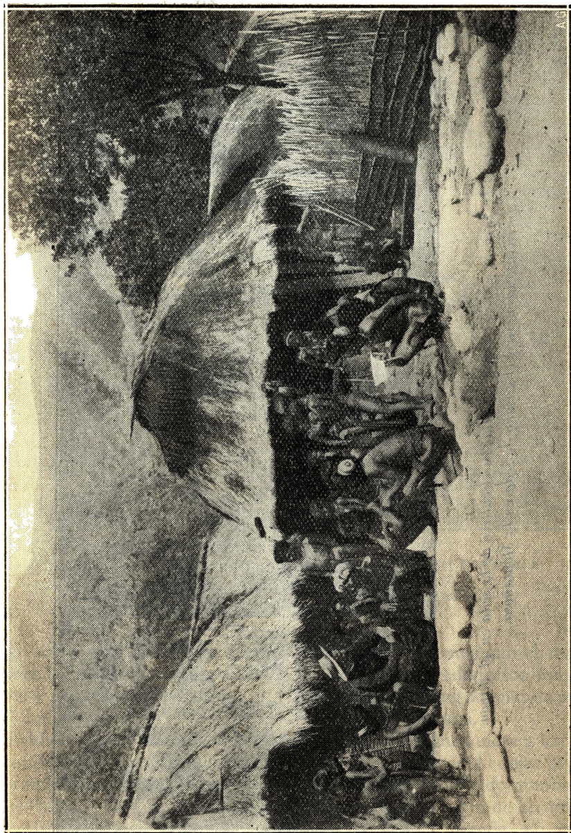
(Del Free Press.)