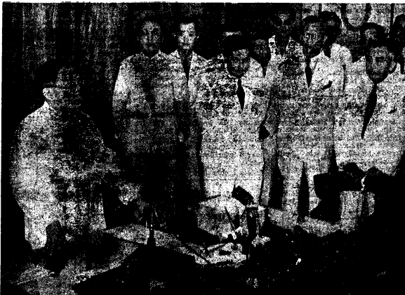
El Presidente electo Jose P. Laurel fotografiado esta mañana en el momento histórico en que anunciaba a todo el mundo por medio de una radiación mundial que la proclamación de la Independencia de Filipinas tendrá lugar el jueves proximo, 14 del actual. El acto que tuvo lugar en un despacho en el Departamento del Interior, fue presenciado por todos los miembros de la Comisión Preparatoria para la Independencia, altos oficiales japoneses y representantes de la prensa.