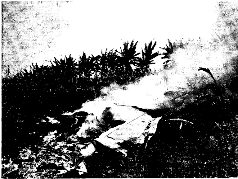
La foto de arriba demuestra las ruinas de uno de los B-24 americanos abatidos en el curso del bombardeo al tun tun en Davao el 1-o de septiembre. En la foto de abajo, un soldado japonés aparece de guardia cerca del cadáver de uno de los seis tripulantes de un aparato americano, con una cruz improvisada plantada en señal de respeto al espíritu del aviador muerto en guerra, aun cuando era un enemigo—un ejemplo de la caballerosidad japonesa en contraste con la ruda brutalidad de los americanos.

Informes de Londres dicen que los cañones de largo alcance ale (Continúa en la última página)