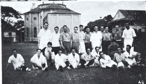
Fotografía inferior—Los dos equipos retratados en amistoso grupo, momentos después del partido.