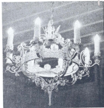
Lámpara de artístico dibujo fabricada en los talleres de