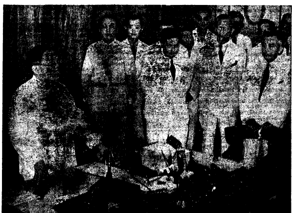
El Presidente electo Jose P. Laurel fotografiado esta mañana en el momento histórico en que anunciaba a todo el mundo por medio de una radiación mundial que la proclamación de la Independencia de Filipinas tendrá lugar el jueves próximo, 14 del actual. El acto que tuvo lugar en su despacho en el Departamento del Interior, fue presenciado por todos los miembros de la Comisión Preparatoria para la Independencia, altos oficiales japoneses y representantes de la prensa.