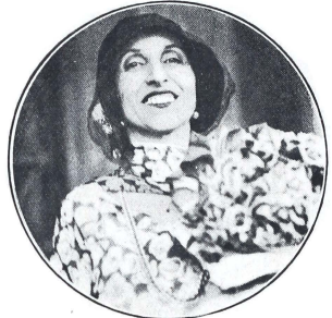
Amelita Galli-Curci, famosa cantante de Opera, que visita Manila para dar una corta serie de conciertos en el Opera House.