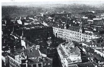
La Plaza, Mayor, a vista de pájaro.

Dí realización a mi plan fletando , vamos al decir, un soberbio cuatrilplano al que bauticé con el enigmático nombre de M N O P Q 5.697, y bien abrigada mi aristocrática figura en confortable abrigo, cubierta mi testa con un reforzado casquete y caladas las gafas, puse en marcha el mo-