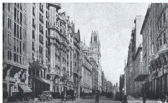
Avenida de Pi y Margall.

para el elemento forastero, el cual, entre su programa de diversiones, no deja de incluir el ver la caída de la bola al dar el reloj de este edificio las 12 campanadas del Mediodía al pasar el astro-rey por nuestro meridiano.