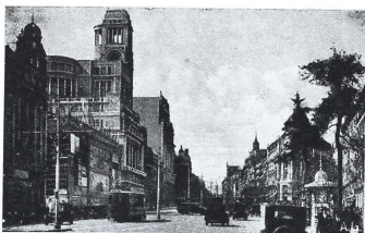
La calle de Alcalá.

mano al transporte de persona alguna, por el temor de que la terminación de mi viaje fuera algún procesamiento por homicidio también involuntario.