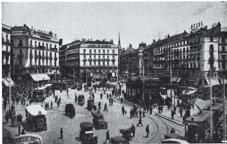
LA PUERTA DEL SOL

tor y comencé mi vuelo sobre la Villa y Corte de las Españas, no sin encomendarme a Sta. Polonia ante el probable caso de que mis ruedas sufrieran algún deterioro o merma, efecto de un involuntario aterrizaje, y renunciando de ante-