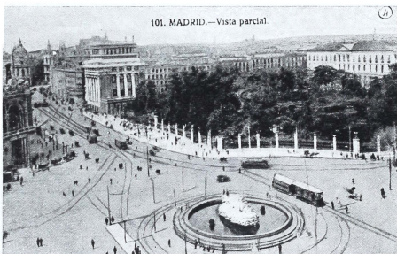
Vista parcial de Madrid.

Pero sigamos adelante. Segundos después estaba situado sobre la Puerta del Sol, el «ombiligo de España», según frase gráfica cuyo autor pertenece al montón del anónimo, lugar madrileño que representa la foto No. 2, en la que apreciarán el «torrente circulatorio» de la popular y madrileñísima Puerta, que por cierto no se vé por parte alguna. Ocupa el centro el antiestético quiosco del «Metro», y por no ser menos en hechos históricos que otros puntos matritenses, ostenta entre sus recuerdos, amén de algaradas y motines, el haber tenido lugar en ella la matanza de mameucos en la fecha de nuestro glorioso 2 de mayo. De intento no aparece el Ministerio de la Gobernación, pues que el edificio do se consuman los encasillados de candidatos a Diputados, y otros menesteres, no tendría el menor interés para Vds.; no así