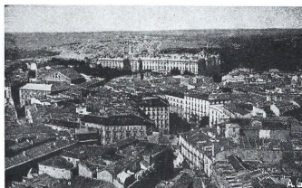
Vista parcial de Madrid desde la Casa de la Prensa.

quierda la esquina del de España, nuestro primer establecimiento de crédito, cuyos sótanos y subterráneos albergan tal cantidad de oro plata y otros metales, que serían causa de la felicidad de cualquier mortal; y hala que hala continué mi viaje para llegar a la plaza de Neptuno (Foto No. 5) en la que explicaré a Vds. que el edificio de la derecha, corresponde al Hotel Ritz, al final de la cuesta se encuentra la estatua de la Reina Gobernadora, a su espalda el Museo de Reproducciones artísticas, y a la derecha la Real Academia Española, encargada de velar por la pureza de nuestro idioma, cabe el lema «Limpia fija y dá esplendor»; más a la derecha las góticas torrecillas de S. Jerónimo, templo destinado a las Bodas Reales, si bien debo hacer constar que todo el aspecto exterior de arte, de esta iglesia, es un camelo, pues de gótico tiene el nombre nada más, ya que no hubo manos godas en su construcción, sino casi contemporáneas, pues se trata sólo de una imitación de la arquitectura de aquella época.