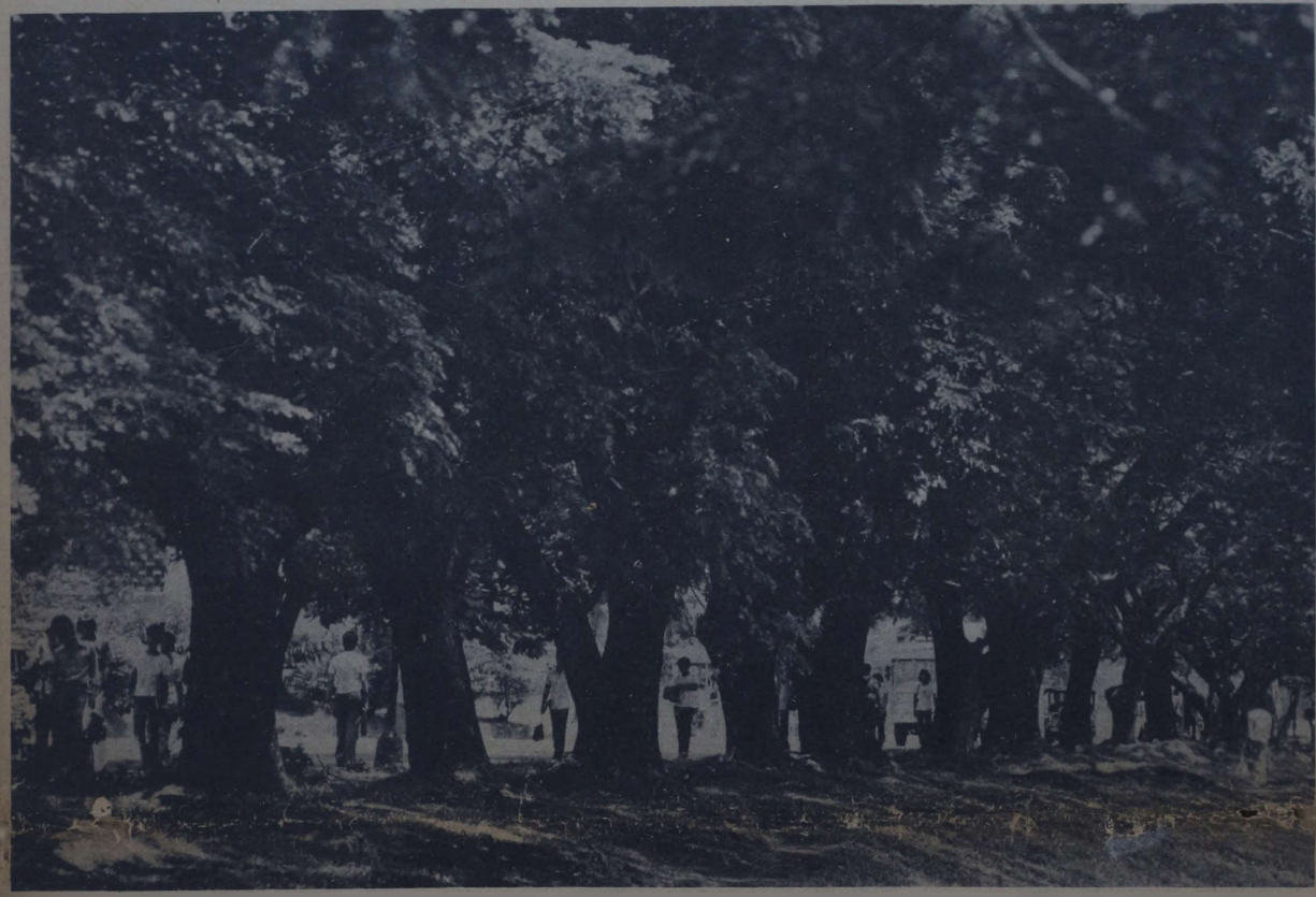
Mga puno: silong sa init, gamot sa maysakit, ligaya sa paningin.

Vol. I, No. 15 FOR GOVERNMENT MANAGERS 1-15 August 1976