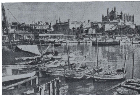
Palma de Mallorca.

Precio de la inscripción para los alumnos internos en el Colegio Mayor: 3,000 pesetas.