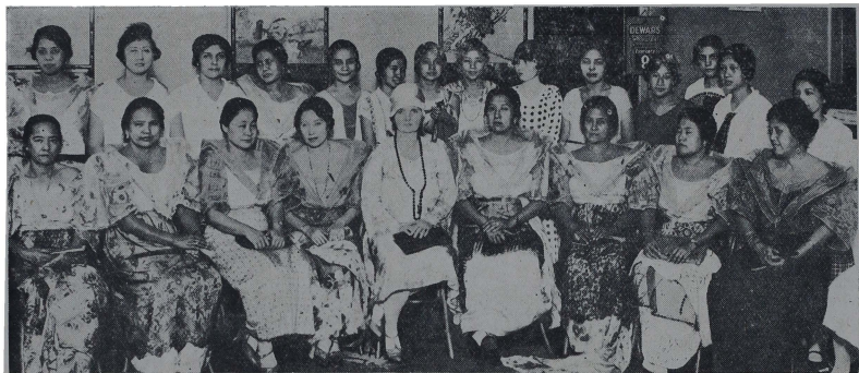
Fiesta de despedida dada en el "Tom's Oriental Grill" en honor a la Sra. de Kingcome, con motivo de su marcha a Europa a la que asistieron conocidas y distinguidas damas de nuestra sociedad.