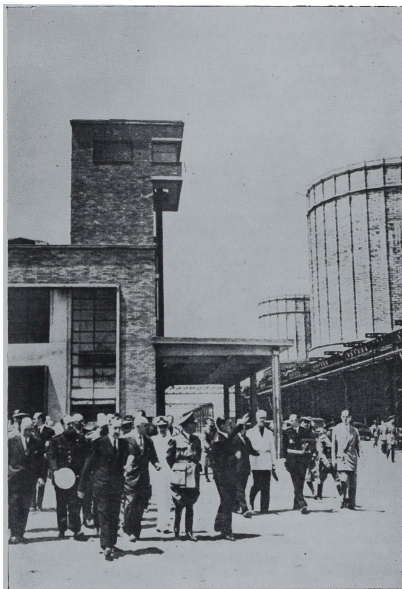
El Caudillo de España visitando la Industria vizcaína.

"El Régimen de nuestro Caudillo no ha perdido la fe y confianza en la eficacia de la iniciativa y el espíritu de la Empresa privada; y buena prueba de ello, es que no ha imitado el ejemplo de otros países que no han vacilado en nacionalizar ciertas industrias básicas, entre ellas la siderúrgica, a pesar de ser en ellos mucho más eficientes estas industrias que en el nuestro. Y la creación de la Siderúrgica de Avilés no contradice en modo alguno esta afirmación, pues se trata, simplemente, en este caso, de supir transitoriamente el esfuerzo del capital privado, totalmente absorbido ahora en la modernización y ampliación de las actuales fábricas siderúrgicas. Pero es absolutamente indispensable para que aquella confianza subsista, que las Empresas privadas, cumpliendo las consignas del Caudillo, acometan con decisión y con fe la solución de los vitales problemas que plantea nuestra economía."