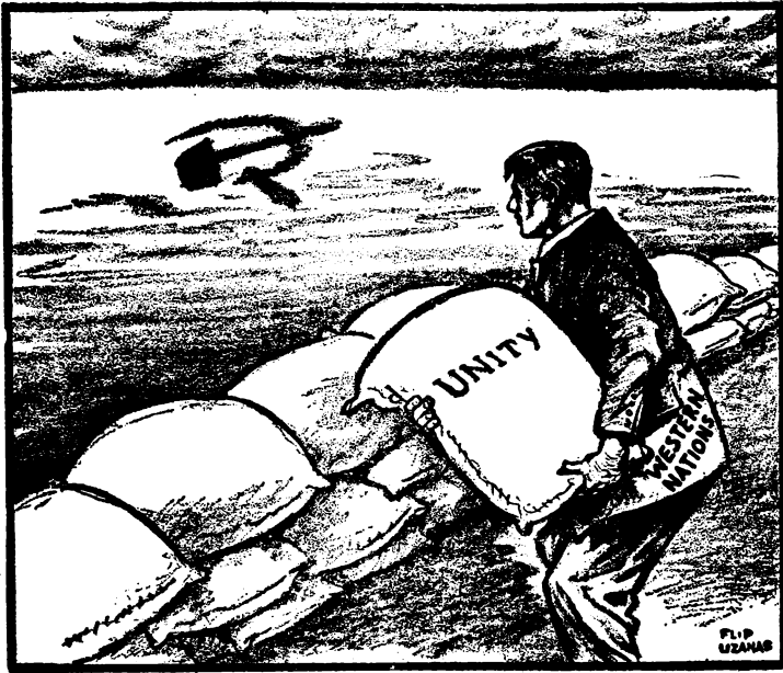
"DEFENSA COMÚN" publicada en The Hartford Courant. Y representa a las potencias occidentales levantando un dique frente a las aguas desbordantes del comunismo internacional.