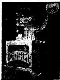
Pangmolde Ng Sabon (Soap Press)

* Kami ay gumagawa ng "DOUGH ROLLER MACHINES" para sa mga Panaderia... maaaring palakarin sa pamamagitan ng kamay o elektrisidad.