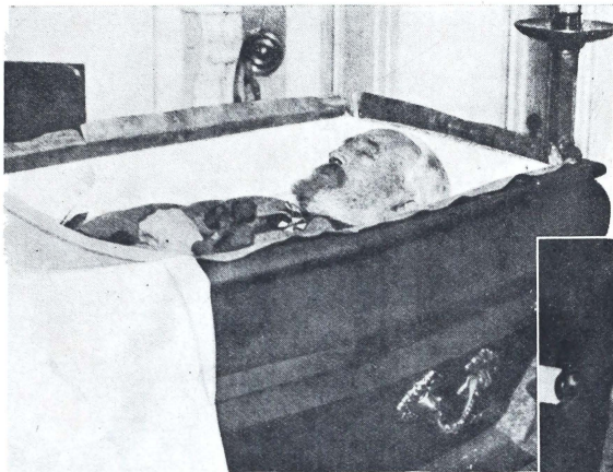
El cadáver del Gran Duque Nicolás Nicolaievich, de Rusia, tío del difunto e infortunado Zar Nicolás II y General en Jefe del Ejército Imperial ruso durante la gran guerra expuesto en la cámara mortuoria en su palacio de Antibes, Francia.