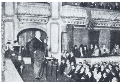
El ex-Ministro Sr. Ossorio Gallardo, pronunciando en el Teatro Rosalía de Castro, de La Coruña, España, un notable discurso durante la Fiesta del Ahorro, celebrada en aquella ciudad con gran solemnidad.