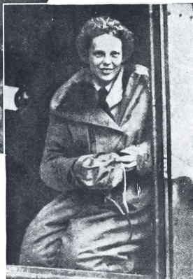
La Srta. Amelia Earhart, que ha ganado la distinción de ser la primera mujer que ha atravesado el Atlántico por la vía aérea, como pasajera.