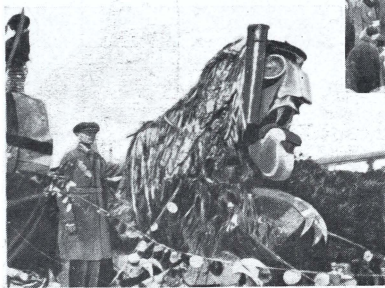
← Sátira antibritánica: "El león inglés", carroza que figuró en una manifestación soviética contra el Capitalismo, y en cuya cabeza se caricaturizó de una manera grotesca a Sir Austin Chamberlain. La Oficina del Exterior del Gobierno Soviet ha prohibido esas manifestaciones.

El Rey Zogu, de Albania, pasando revista a los carros blindados de su ejército, que ha modernizado grandemente, para convertirlo en uno de los mejores del mundo. →