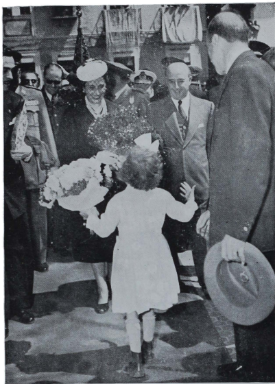
SEVILLA.—Una niña de las escuelas públicas del barrio de triana, entre un ramo de flores a la esposa del Jefe del Estado.

artistas franceses que vengan a conocer España e inspirar su obra en los motivos estéticos de nuestras escuelas de arte.