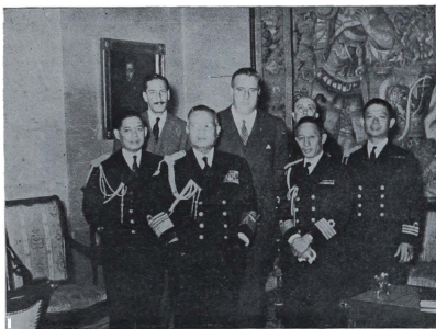
Madrid. La Delegación de marinos tailandeses durante su visita al Ministro de Asuntos Exteriores español en su despacho oficial del Palacio de Santa Cruz.