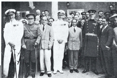
(Arriba) La oficialidad del "Path Finder" con los aviadores españoles, en la embajada inglesa.

Y ahora preparémonos a disfrutar en la verbena que prepara el Ministerio del Ejército en