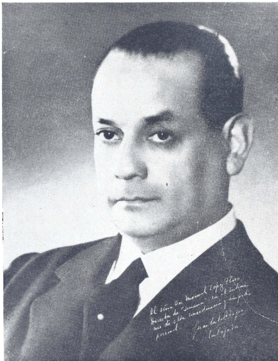
DON JUAN CARLOS RODRIGUEZ, Embajador Argentino en China,

Desearnos al ilustre personaje feliz arribo a su destino y nuevos lisonjeros triunfos en su actual cargo.