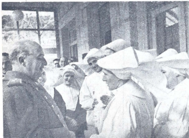
S. E. el Jefe del Estado inaugura el nuevo Sanatorio Antituberculoso Militar en Guadarrama. S. E. es saludado por las Hermanas de San Vicente de Paúl que tienen a su cargo la asistencia de los enfermos.

En realidad, los refugiados procedentes de Europa Central nunca consideraron a China como punto de destino, sino más bien como sitio de tránsito, desde donde esperaban llegar a territorio de los Estados Unidos, Australia u otros países para comenzar allí una nueva vida después de los horrores que sufrieron durante el odiado régimen Hitlerista. REUTERS