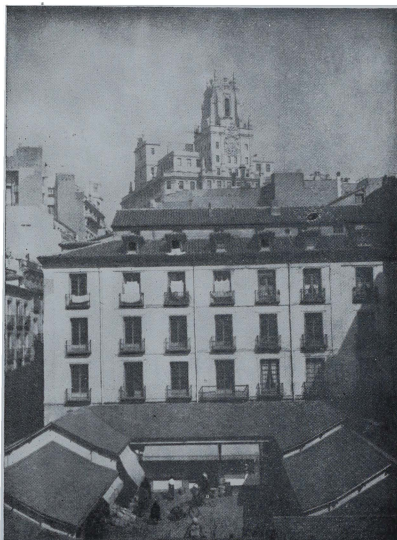
Del Madrid del siglo XIX—tiros por las calles, Galdos, monsergas y Restauración—salen las puntas del nuevo Madrid (Calle de los Reyes, Plaza del Carmen).