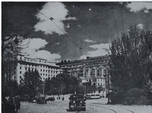
En la Plaza de Colon, centro geométrico de la ciudad, se han levantado estas casas para vivienda y oficinas. La de la derecha es una muestra muy afortunada de lo que puede llamarse "arquitectura de Madrid". A sus pies, una vieja casa casi centenaria, construida en el campo y que ha quedado ya en el centro de la ciudad, resistiendo aun el derribo.

been subconsciously nurturing for years. By all means visit Spain and try to understand it. You will find