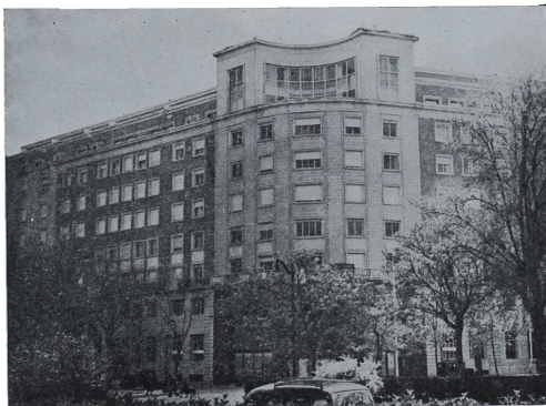
Nuevos hoteles para el turismo de lujo, en el Paseo de la Castellana de Madrid.

wise, Do not try to go at the time of the great fiestas or religious celebrations without the most careful and assured accommodations in advance, for the French tourists, the British tourists, as well as the American tourists, have been busy discovering Spain. The hotels have been literally burst apart by the influx. But go when you can and with accommodations assured and it will be a happy, profitable day for you."