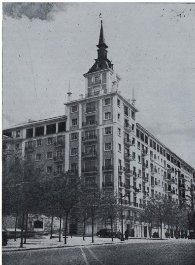
Además de las viejas ciudades ya tan conocidas, España tiene las que corresponden a nuestra época (Casas para vecinos en el Paseo del pintor Rosales. Madrid).