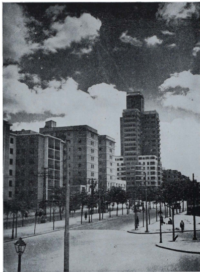
En las avenidas de las afueras, las casas para la clase media. Arquitectura internacional, apenas sin personalidad, permitida en los barrios sin historia. (Avenida de América. Madrid)

it still by far the cheapest country in Europe in terms of the American dollar. You will find it hospitable, courteous, and entertaining. Yet one word to the