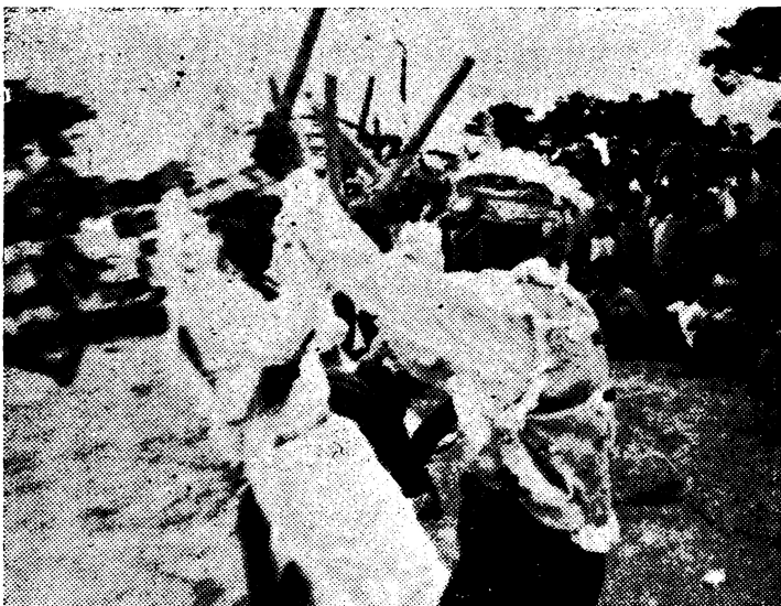
Batanes tiene su tradición pintoresca. Esta danza guerrera de sus hombres, extraña, curiosa, lo atestigüa.

Según documentos existentes en los archivos del Convento de los Padres dominicos en (Pasa a la pág. 34)