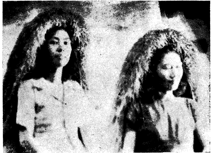
Mujeres de Batanes, luciendo sus típicos "capotes" para resguardarse de la lluvia y el sol. Son a modo de abrigos tejidos de palmera de fenicia.

Batanes es una verdadera mina de la que se puede extraer con sudor y pulso dirigidos por una mentalidad sensitiva a las condiciones particulares del tiempo y del espacio, los mil y un productos que por valor de millares de pesos importa la República Filipina de las regiones templadas y semitempladas, como frutas, verduras, etc. Los generosos españoles de la venerable Orden de Padres Dominicos que se han encargado de la dirección espiritual de sus habitantes por dos siglos y medio de continuo, intenso y extenso trabajo misional no se limitaron a lo puramente espiritual. Se esforzaron también en ponerse al frente del desenvolvimiento material de esas lejanas tierras. Junto con el símbolo de la victoria que es la Santa cruz y el Santísimo Rosario, tuvieron la azada y el gaván. Sementera tras sementera y jardín tras jardín cultivaron los misioneros