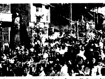
Remate de la celebracion de la Semana Santa en Manila ayer, con la procesion del Santo Entierro que hizo el Serron de las Siete Palabras, producido en varios tiempos. Esta procesion es la que salio de la Iglesia de Paco.

(Continuacion de la página 1) ... de angel tal del covacho y quita el manto negro de la Virgen demostrando la alegria de la Madre al ver otra vez vivo a su Hijo Amado. Después de esta ceremonia las dos procesiones juntas se dirigen a la iglesia donde se celebra una misa solemne. Ayer, Viernes Santo, fué el apogeo de la celebración de la Semana Santa. Las calles se llenaron de gente que desafiando el calor del sol, acudio a las ceremonias de la mañana y al melodioso al Serron de las Siete Palabras en la procesion del Santo Entierro.