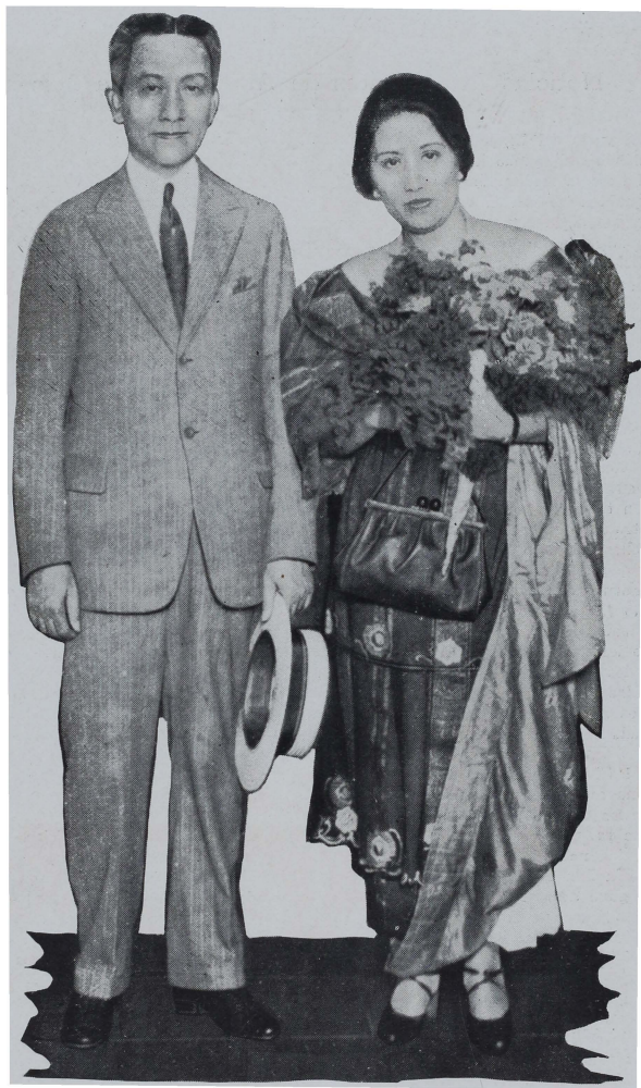
El Senador Hon. Sergio Osmeña con su Señora, momentos después de desembarcar en el "Pier 7", desde donde se dirigió inmediatamente al edificio de la Legislatura para asistir a la recepción popular de bienvenida, en la que pronunció un discurso de saludo al pueblo, declarando, entre otras cosas, una verdad amarga y desgraciadamente muy conocida por todos: "Tan solo Dios sabe cuando nos será concedida por el pueblo americano la tan ansiada independencia": manifestación dicha con la sinceridad característica en el Senador Osmeña.