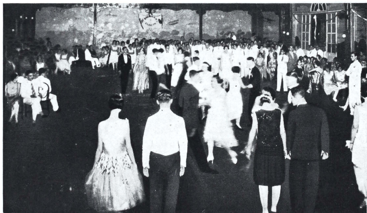
El baile de aniversario de la "Sociedad Electa". Una de las fases del Rigodón, con que se inició la fiesta, muy concurrida y animada, y en la que no decayó el entusiasmo hasta cerca de las tres de la madrugada.