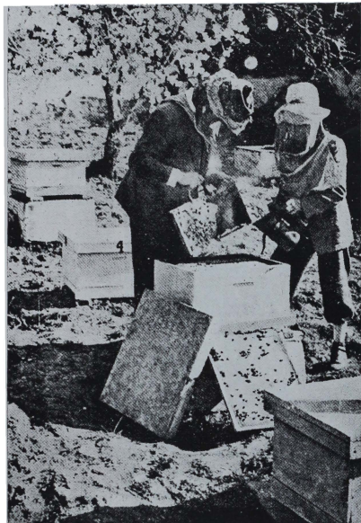
Coto Escolar Apícola de Alcántara (Cáceres). Revisando una colmena.