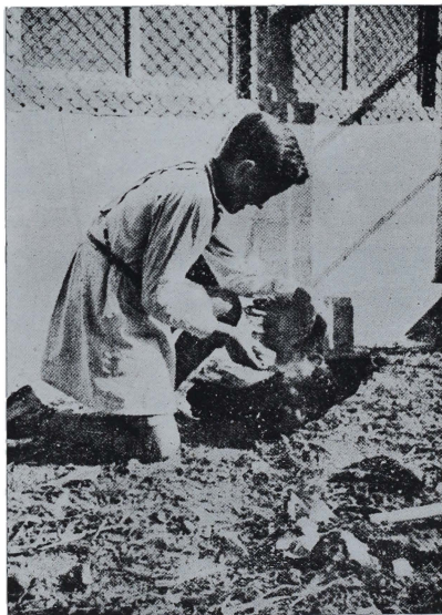
Coto Escolar Avícola San Antonio de San Fausto de Campenelles (Barcelona). Alumno tratando a un ejemplar del Coto.

El maestro, por su trabajo de dirección del Coto obtiene el 25% de los beneficios, con objeto de estimularle. La labor de éstos Cotos está vigilada por Comisiones Provinciales que a su vez dependen de una Comisión Nacional.