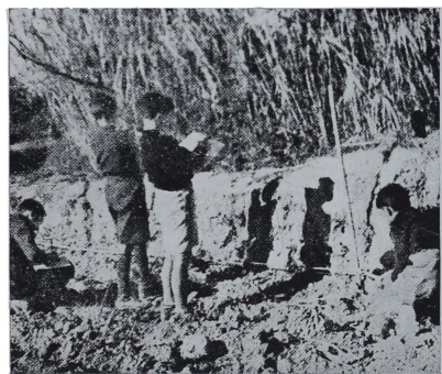
Mutualistas del Coto Escolar de la Escuela de O. A. de Mayorazgo de Alquerías (Murcia), efectuando operaciones para plantaciones.

Los Cotos Escolares fueron creados en 1945 por la Ley de Educación Primaria. En cada escuela existirá un Coto Escolar y una Mutualidad. Esta para estimular en el pequeño alumno la previsión, para que al llegar a la mayoría de edad puedan costearse sus propios medios de trabajo; las niñas para que dispongan de una dote matrimonial.