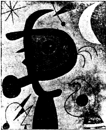
Juan Miró—"La espina roja traspasa las plumas azules del pájaro de pálido pico."