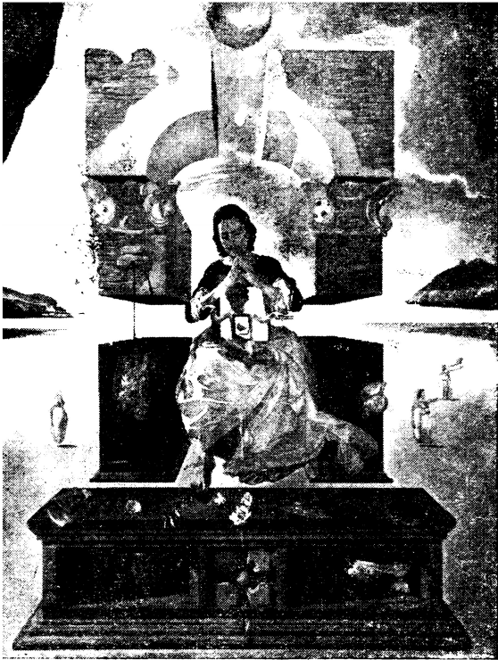
Dalí. "La Madona de Port Lligat".