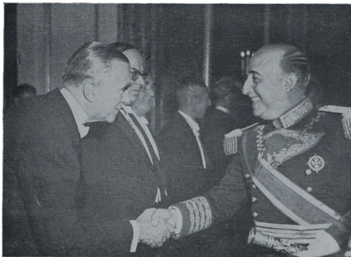
Franco y el Embajador de los Estados Unidos.

El pasado 12 de Octubre el Jefe del Estado español presidió, en la sede del Consejo Superior de Investigaciones Científicas, los actos organizados por el Instituto de Cultura Hispánica.