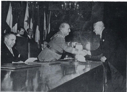
Madrid 12-10-53. Con ocasión de celebrarse el Día de la Hispanidad S.E. el Jefe del Estado hizo entrega de los títulos de Miembros de Honor del Instituto de Cultura Hispánica. El Excmo. Sr. Embajador de Filipinas en Madrid en el momento de recibir el título.

Se refirió el Sr. Artajo a la participación constante de España, durante el último año en las grandes Agencias técnicas supranacionales. En el último año España ha firmado en Hispano-américa 7 acuerdos económicos,