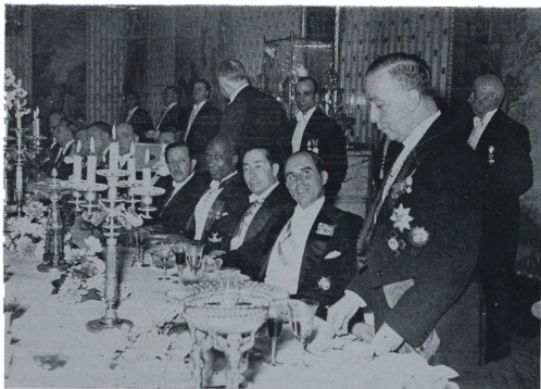
CENA DE GALA EN EL PALACIO DE VIANA CON OCASIÓN DE LA FIESTA DE LA RAZA. El Ministro de Educación Nacional del Brasil durante su discurso. Junto a él el Secretario español de Asuntos Exteriores.

4 de cooperación cultural y científica y 2 de paz y amistad. Se refirió a su viaje a Filipinas y a las diversas personalidades extranjeras a España, que culmina con las jornadas de Lengua y Literatura de Salamanca y la gran Asamblea de Universidades hispanicas.