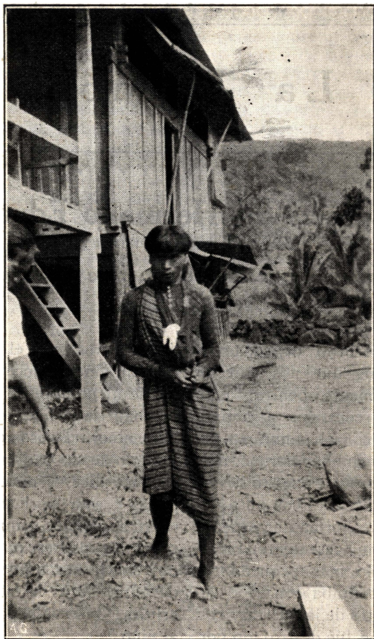
Un Kalinga en su vestido de gala.

su cena consistente en la tradicional morisqueta y pollo o gallina. Esta gente sencilla me devoraba.... claro está que con los ojos, ejercicio en que fueron ayudados por todos los vecinos de las otras seis casitas, y aquellos que no podían entrar miraban por las ventanas y por los