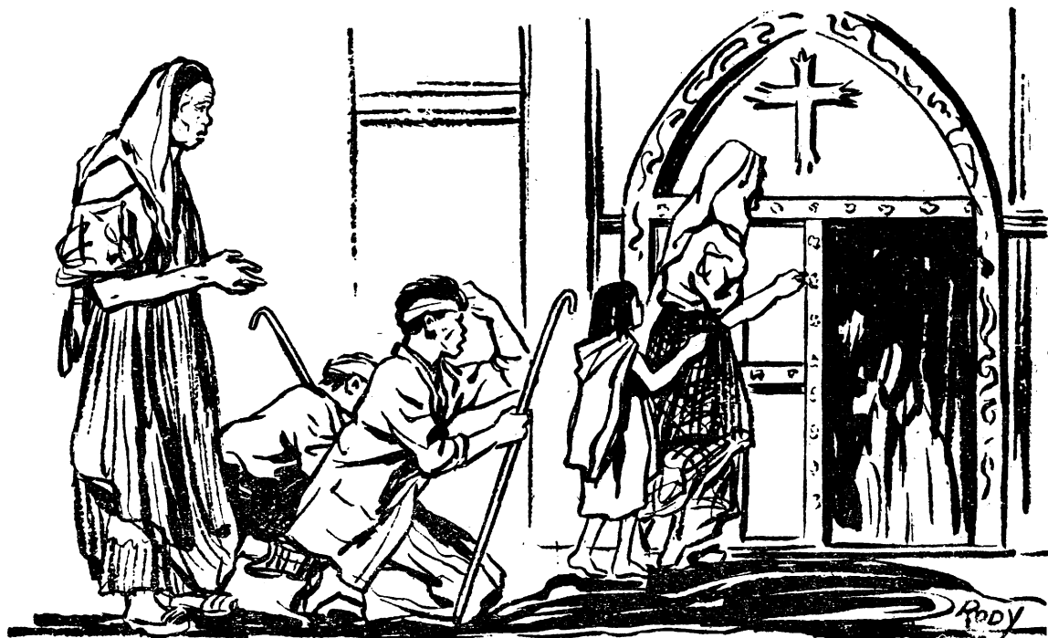
Sa labás ng simbahang ito'y marami ang naghanay na pulubi.