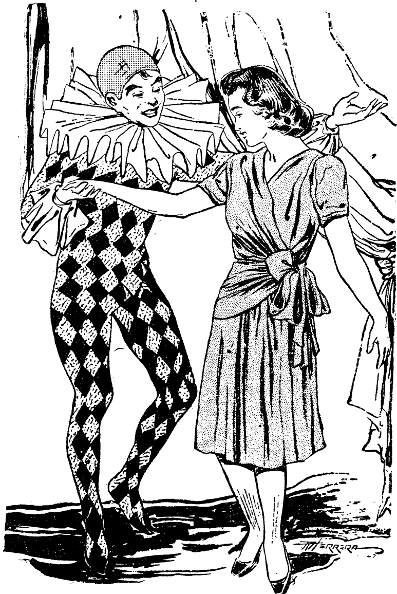
Ipinagtapát ng mapagpatawáng payaso ang banál na lihim ng kanyáng puso, nguni't nápatawá lamang si Mercedes.

Sa likod ng telon, isang gabii'y hindi nakapagpigil si Renato. Hin-