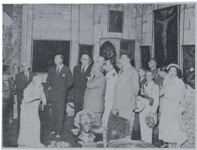
SAN SEBASTIÁN.—12/8 53.—S. E. el Jefe del Estado y esposa acompañados de Miembros del Gobierno, visitan el museo de Zumaya en Zumaya, donde fueron recibidos por la familia del que fué famoso pintor.