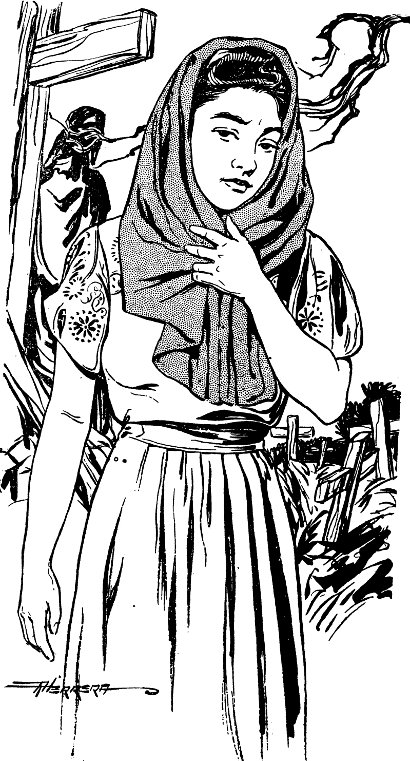
Isang babae ang dumating na nakapamindong ng itim na sutla at sinasala ng paningin ang mga nagtayong kurus.

pagtatanod. Ang babaing dumating na nakapamindong, kung may magsusuring paningin sa kanyang anyo ay walang salang manggigilalas.