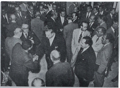
CONGRESO IBEROAMERICANO DE COOPERACIONES ECONÓMICAS