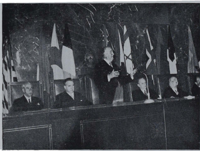
Madrid 5-6-53. Se inauguran las sesiones del Congreso Internacional de Transportes. El Ministro de Obras Públicas durante su discurso inaugural. Le acompañan en la presidencia los Ministros de Asuntos Exteriores y Secretario del Movimiento.