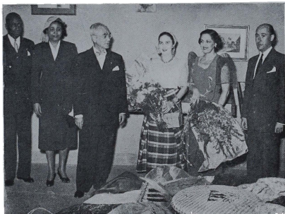
Madrid 5-6-53. SE CELEBRA EN EL INSTITUTO DE CULTURA HISPANICA LA SEMANA DE FILIPINAS. La Excmo. Sra. de Martín Artajo, esposa del Ministro de Asuntos Exteriores, ataviada con el traje típico filipino, visita la exposición de objetos y arte de aquel país. La acompañaban el Embajador de Filipinas y señora y otras personalidades.