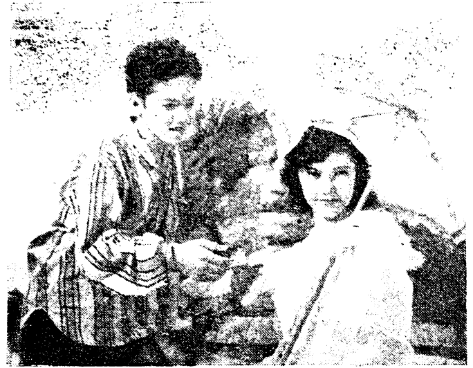
Si Boy Francisco at Corazon Rivas sa pelikulang "Sawa Sa Lumang Simboryo" ng P.Premiere Productions. Ang karamihan ng mga tagpo sa pelikulang ito ay kuha sa Sta. Maria, Ilocos Sur. Ang nagsisiganap ng mga pangunahing papel ay sina Jose Padilla, Jr. at Anita Linda sa ilalim ng pamamahala ni direktor Gerardo de Leon. Kasalukuyang itinatanghal sa sine LIFE.