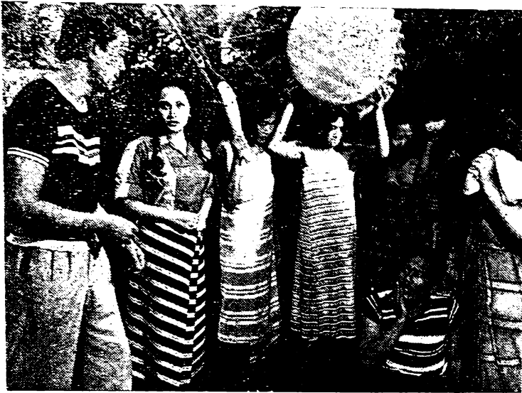
Isang tagpo ito sa pelikulang "TEXAS" (ang manok na nagsasalita) na likha ng SAMPAGUITA PICTURES. Pinangungunahan nina Pancho Magalona at Linda Estrella. Direksiyon ni Armando Garces. Sa larawan ay mapansin niyong nag-aaway sina Pancho at Martin Marfil. Nakamasid si Linda Estrella. Kasama ang ilang ekstra.