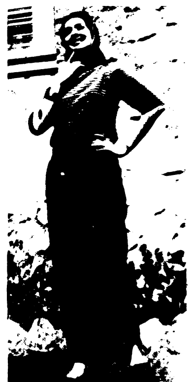
Itaas: si Gloria Romero, sa isa pa rin sa maririkit niyang larawan. Kay-ganda ug tanawing makikita, kung sa umaga ay ang ganyang anyo ni Gloria ang ating mamamalas...