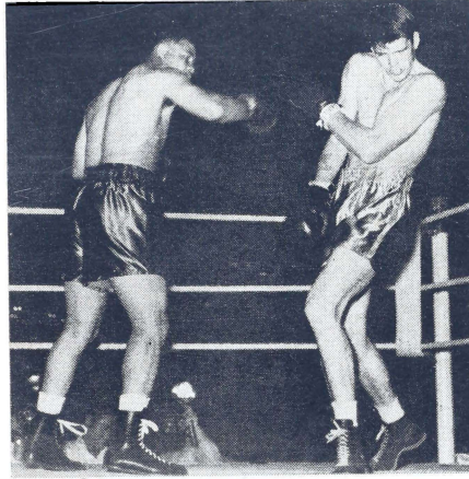
Joe Louis lanza un aparente "fuerte derechazo" contra el joven y tallado Jim Wilkins, del Ejército americano, que trata de cubrirse el cuerpo con ambos brazos en un gesto de gran temor.