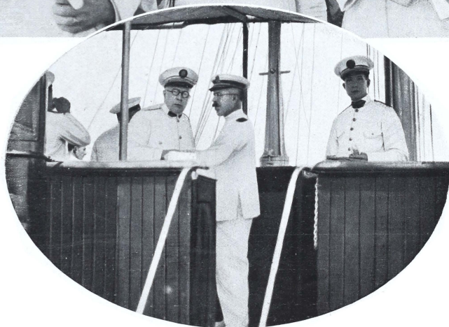
El consul de España en Filipinas, don Manuel de la Escosura, y el Viceconsul, Don Ricardo Muñiz, con el comandante Don Cláudio Lago de Lanzas y Diaz, en la cubierta del buque y en el puente de mando, momentos después de haber fondeado el mismo en bahía.