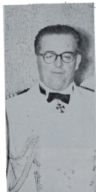
EL CAPITAN DE NAVIO DE LA MARINA ESPAÑOLA DON INDALECIO NUÑEZ

De vieja familia marinera española nació en Ferrol del Caudillo en 1902 e ingresó en el Servicio de la Armada en 1916. Navegó por los mares de Europa, Africa y América y desempeñó varias comisiones del Servicio en el extranjero. Cursó los Estudios Superiores de Artillería y Estado Mayor y ha desempeñado varios años el Profesorado de Arte Naval y Estrategia en todas las Escuelas Superiores de Guerra Españolas. Asistió a todas las campañas de Marruecos a partir de 1921 hasta el desembarco de Alhucemas y a las de la Guerra de Liberación prestando sus servicios en el Cuartel General del Generalísimo durante la última parte de la Campaña. Está en posesión de numerosas condecoraciones españolas y extranjeras, premio a sus 37 años de buenos servicios.