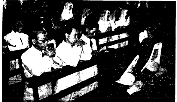
La celebración del Tenryo-Setu tuvo tambien su fase religiosa con la misa que tuvo lugar esta mañana en la iglesia de la Ermita. Miembros de la Comunidad Católica Japonesa asistieron al santo sacrificio.