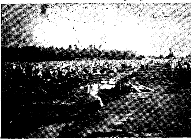
Tambien en Legaspi, Albay, los filipinos, japoneses y chinos estan colaborando en el trabajo voluntario para la construcción necesaria de los proyectos.