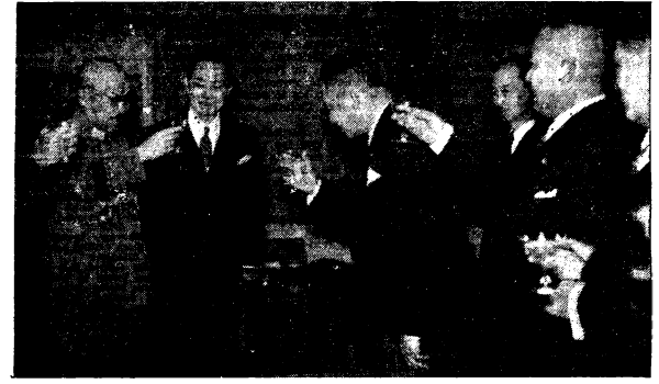
Durante el brindis ofrecido mutuamente cuando la Misión Filipina de Gratitud al Japon, encabezada por el Speaker Benigno S. Aquino, fue a ofrecer sus respetos al Premier General Hideki Tojo en su residencia oficial, Adomas del Premier Tojo y el Speaker Aquino, aparecen tambien en la foto, entre otros, el Embajador Jorge B. Vargas y el Presidente Jose Yulo del Tribunal Supremo de Filipinas.

(De la Agencia Demer) Lisboa, 26 de abril.—El Primer Ministro Australiano John Curtin, viajó a Londres para asistir a la conferencia de primeros ministros de los Dominios Británicos después de la prensa en Washington que Australia rechazaría cualquiera demanda americana para el uso de las bases de Australia en la guerra, según un despacho de Nueva York. Preguntado acerca del uso de las bases de Australia y Nueva Zelanda por los Estados Unidos después de la guerra, el Primer Ministro Curtin declaró que ninguno puede demandar que está baso