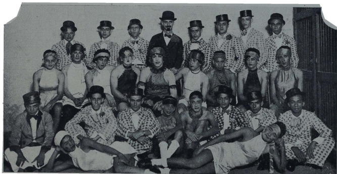
Comparsa "Foolish Bergere" del Bohemian Sporting Club que obtuvo el 3er. premio.