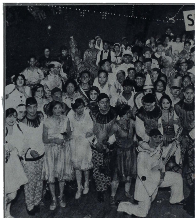
Comparsa "Amor de Carnaval" organizado por [illegible] que obtuvo [illegible]