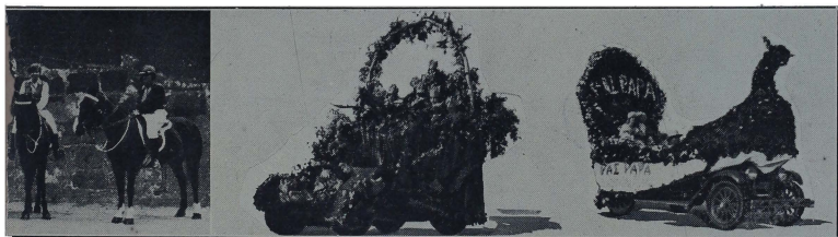
escollaron el auto de parada floral.