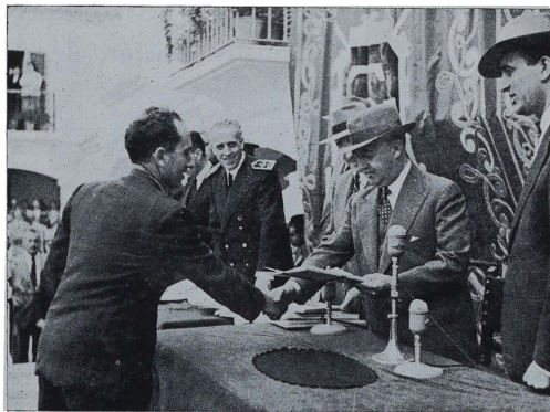
En Barca de la Florida (Cádiz) inaugura el pueblo y entrega casas y terrenos a los campesinos.

El día 28, Franco marchó a Córdoba donde inauguró el nuevo puente sobre el Guadalquivir, que tiene una longitud de 240 metros (ocho arcos de 25 metros de luz). En el Gobierno Civil examinó los planos de la Universidad Laboral de Córdoba, que ya ha entrado en la fase de construcción y en la que vivirán, en régimen de internado, 1.500 jóvenes que aprenderán en ella las técnicas agrícolas, industriales y pecuarias