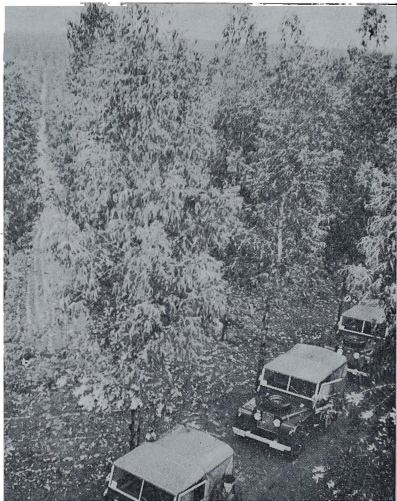
En Huelva, recorre la nueva zona forestal de Almonte y Bonares.

El 23 de Abril visitó en Sevilla la antigua Fábrica de Tabacos, uno de los más grandes edificios de España, cedi-da hace unos años para ser convertida en Universidad de Sevilla (25.000 metros de superficie) y próxima a inaugurarse.