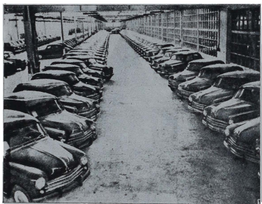
Vista de la fábrica y de una de sus naves, con la producción de un mes dispuesta para la distribución.