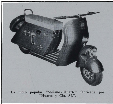
La moto popular "Soriano-Huarte" fabricada por "Huarte y Cia. SL".