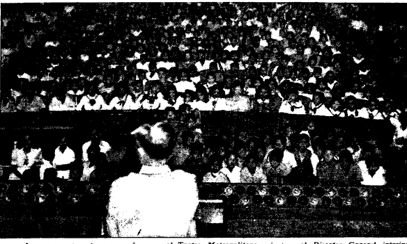
Intenstancia tomada esta mañana en el Teatro Metropolitan, mientras el Director General interino Camilo Osias, dirige la palabra a los miembros de la Kalibapi Menor, durante la primera convocatoria de esta organización celebrada este día. En primer termino, de espaldas, se ve al orador, y en el fondo, a parte de la numerosa concurrencia de jóvenes de ambos sexos.

La juventud de hoy día, a pesar de su pequeña estatura, sus defectos y vicios, sigue siendo "la bella esperanza de la patria" que sedució a Rizal, y por esto debe vivir, comportarse y conducirse de modo que encarnen, dijo idéntico del héroe nacional, dijo el Dr. Camilo Osias, director general interino de la Kalibapi, en el discurso que pronunció a las 9:30 de esta mañana, en el Teatro Metropolitan, con ocasión de la primera convocatoria general que retribuya los miembros de la Kalibapi Menor.