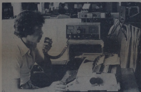
Sa pamamagitan ng radio transmitter, maipababati ng mga observers ang anumang abnormalidad sa bulkan.

Habang dumarami ang naddiskubreng bulkan, larang lumalaki ang nakababagang panganib. Kung kaya, nilikha ang isang lupon na ang tanging tungkulin ay alamin ang mga aktibidad ng mga bulkan upang maiwasan at mabawasan ang labis na pinsalang idinudulot ng mga ito.