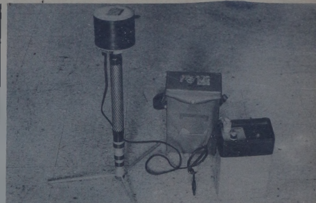
Ang magnetometer, isa sa mga instrumento sa pagprediksyon ng pagsabog ng bulkan.

Sa seismometric method, ang instrumentong ginagamit ay seismograph.